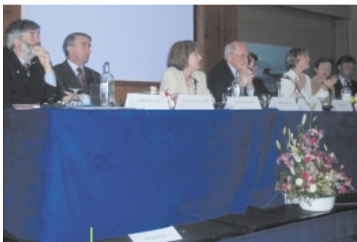
Europe en Action 2004, table ronde avec des candidats aux élections européennes

“ Notre travail à nahmi , en ce qui concerne l’influence politique, à la fois au niveau national et international, est soutenu par le travail innovateur d’Inclusion Europe. Le mouvement de l’auto-représentation en Irlande en particulier, ces dernières années, s’est inspiré du travail d’Inclusion Europe. En 2004, nous avons eu l’opportunité de rassembler tous les candidats irlandais pour les élections européennes pendant la conférence “Europe en Action 2004” à Dublin. Cela a permis aux personnes handicapées mentales, leurs familles et leurs proches de faire connaître leur point de vue et leurs problèmes aux futurs députés européens” . Deirdre Carroll, Directeur, nahmi.